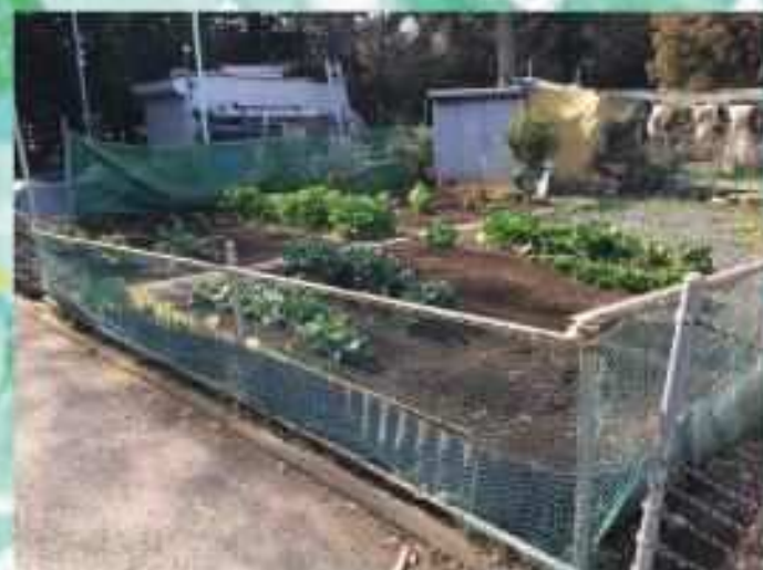
現地写真 (撮影: 2023年3月)

所在地: 相模原市南区大野台3丁目 地積: 134 m 2 都市計画: 市街化調整区域 用途地域: 定めのない地域 土地権利: 所有権 地目: 山林 現況: 更地 (農作物・倉庫等あり) 接道: 前面私道 (持分あり) 引き渡し: 即時